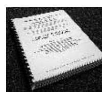
Reporte de factibilidad y diseño presentado a ACIDI, Febrero 2002.

Para más información favor consultar la página WEB del proyecto: