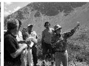
Febrero 2002 - viaje de campo a Maipú, Chile.