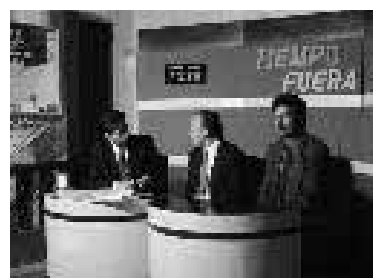
Noviembre 2001 - Programa de noticias, Loja, Ecuador.