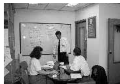
Noviembre 2001 - Reuniones en INGEOMINAS Bogota, Colombia.