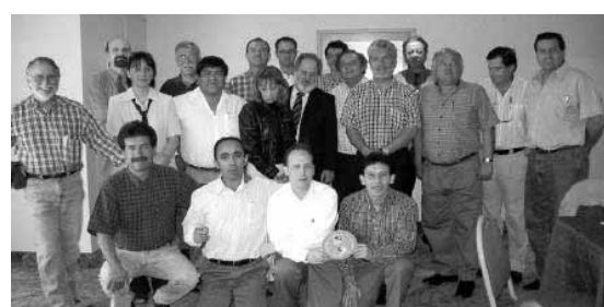
Febrero 2002 - Reuniones del Consejo Ejecutivo, Santiago, Chile.