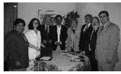
Noviembre 2001 - Montevideo, Uruguay. Primera reunión del PMA:GAC.