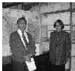
Enero, 2002 - Observatorio San Calixto La Paz, Bolivia.