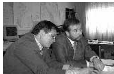
Octubre 2001 - SEGEMAR, Argentina.