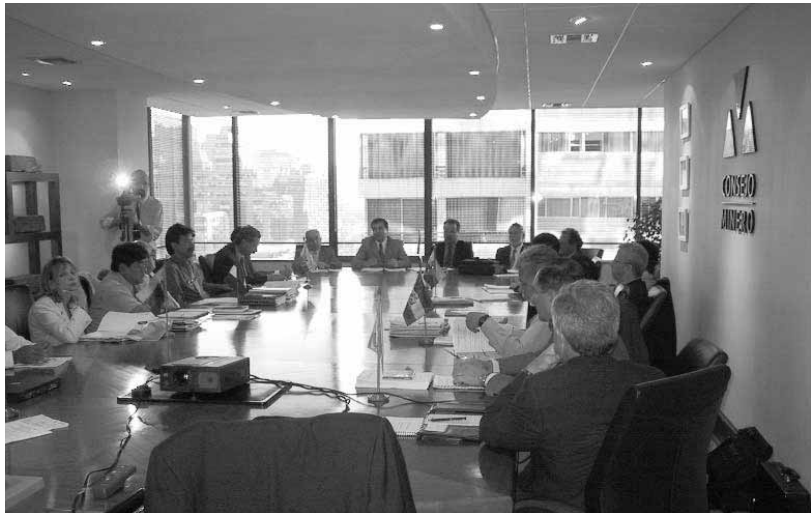
Primer día de las reuniones del consejo ejecutivo del PMA:GCA en el Consejo Minero, Santiago de Chile, 5 de Febrero del 2002.