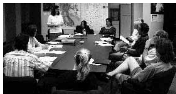
GSC - Agosto 2001, EDP del PMA-GCA con otros contribuidores, Canada.