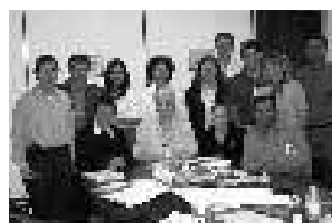
Diciembre, 2001 - INGEOMIN Equipo del PMA:GAC Caracas, Venezuela.