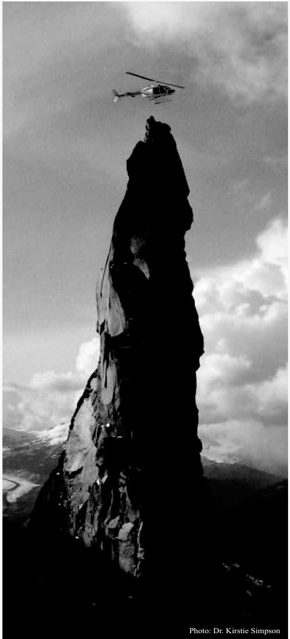
Figura 2: Helicóptero con la antena del GPS diferencial unida sobrevuela un afloramiento distintivo, usado como punto de control de tierra para la creación de un MDE. La colección de datos en este punto tomó cerca de 10 segundos.

Hay una variedad de métodos alternativos de levantamiento, menos costosos y de tecnología menos sofisticada que puede ser